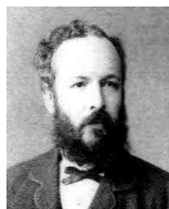
Georg Ferdinand Ludwig Philipp Cantor (1845-1918)