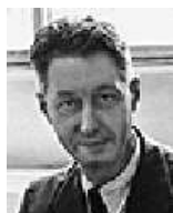
Pierre Etienne Bézier (1910–1999)