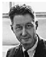
Pierre Etienne Bézier (1910–1999)