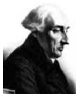
Joseph-Louis Lagrange (1736–1813)