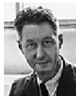
Pierre Etienne Bézier (1910–1999)